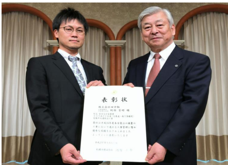
三浦作業所長(左)と阿部社長